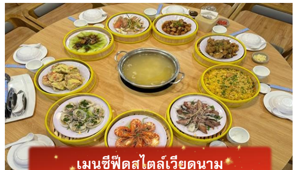
เมนูซีฟู้ดสไตล์เวียดนาม