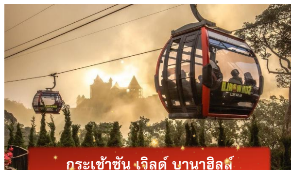
กระเช้าขึ้น เวิลด์ บานาฮิลล์