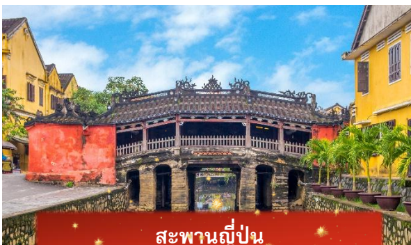
สะพานญี่ปุ่น

จากนั้นนำท่านเดินทางสู่ เมืองโบราณฮอยอัน เมืองมรดกโลกที่ยังคงเอกลักษณ์และรักษาวัฒนธรรมไว้อย่างดีเยี่ยม โดยท่านสามารถเดินเล่น ถ่ายรูป ตามตรอกซอกซอยต่างๆ ได้ ไฮไลท์ของการมาถ่ายรูปเช็คอินที่นั่นคือการได้ขึ้นไปถ่ายรูปจากมุมสูงของคาเฟ่ที่อยู่ตามซอกซอย นำท่านชม สะพานญี่ปุ่น สะพานแห่งมิตรไมตรี ที่ได้ชื่อนี้เนื่องจากสะพานแห่งนี้สร้างขึ้นโดยชุมชนชาวญี่ปุ่น เป็นสะพานที่สร้างขึ้นข้ามคลองที่ในอดีต 400 ปีกว่าที่ผ่านมา