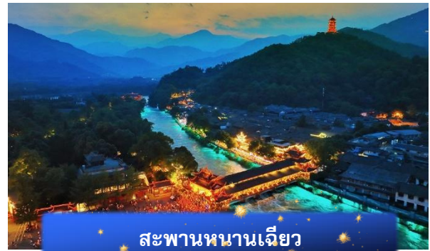
สะพานหนานเจียว

จะสร้างประสบการณ์สุดตื่นตาตื่นใจในยามค่ำคืน สวยงามและน่าประทับใจจนคุณไม่อาจลืม การแสดงอาถรรพณ์ในกรณีที่มีฝนตก หรือเหตุสุดวิสัยใด ๆ ทางบริษัทขอสงวนสิทธิ์ในการไม่คืนค่าบริการ เนื่องจากการแสดงนี้ไม่มีค่าเข้าชม