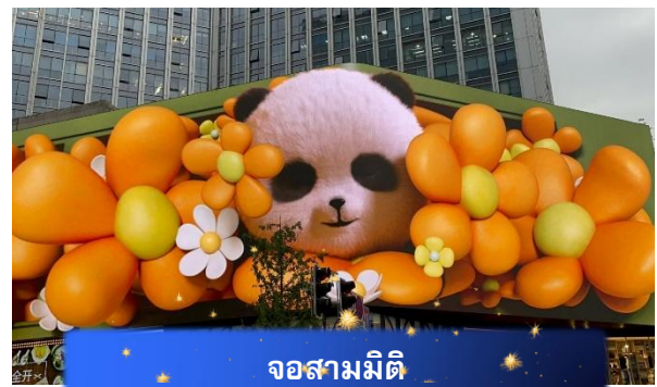
จอสามมิติ

เดินทางสู่ ถนนคนเดินชุนซีลู่ ย่านช้อปปิ้งสุดคึกคักของเฉิงตู คล้ายกับสยามในกรุงเทพฯ เต็มไปด้วยร้านค้าหรือจำหน่ายสินค้า เพราะมีทั้งแบรนด์ดังและห้างสรรพสินค้าชั้นนำ รวมถึงร้านในตรอกซอกซอยที่ราคาเริ่มต้น 10 หยวน นำท่านชม แพนด้าปิ่นตึก แคว้นอยู่บนอาคาร IFS และอย่าพลาด จอสามมิติ ขนาดใหญ่ที่แสดงภาพน่ารักของหมีแพนด้า สุดท้ายเดินทางสู่ ถนนไท่กู่หลี่ แหล่งช้อปปิ้งหูจกกลางเมืองที่ผสมผสานสถาปัตยกรรมจีน