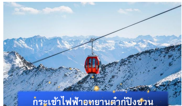
กระเช้าไฟฟ้าอุทยานต๋ากู๋ปิงชว่น

นำท่านดื่มด่ำกับมหัศจรรย์แห่งหิมะกลางขุนเขา นั่งกระเช้าไฟฟ้าอุทยานภูผาหิมะต๋ากู๋ปิงชว่น สัมผัสความงดงามเหนือจินตนาการของผืนหิมะขาวโพลนที่ทอดยาวสุดสายตา หนึ่งในลานน้ำแข็งธรรมชาติที่เข้าถึงง่ายที่สุดในประเทศจีน ที่ซึ่งฤดูหนาวโอบกอดขุนเขาไว้อย่างแสนอ่อนโยน เปลี่ยนภูมิทัศน์ให้กลายเป็นโลกแห่งเทพนิยาย เพลิดเพลินไปกับการนั่งกระเช้าไฟฟ้าที่พาท่านไต่ระดับขึ้นสู่จุดชมวิวยามความสูงกว่า 4,800 เมตร ท่ามกลางทัศนียภาพของเทือกเขาหิมะที่ขาวสะอาดดั่งผ้าฝ้ายพราวแสง พระอาทิตย์สะท้อนผืนหิมะเป็นประกายราวอัญมณีบนฟากฟ้า ทุกก้าวย่างคือความตื่นตาตื่นใจ กรณีกระเช้าปิดคืนค่ากระเช้าท่านละ 150 หยวน/ท่านโดยไม่แจ้งให้ทราบล่วงหน้า