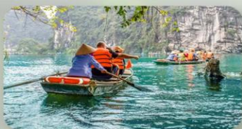
ล่องเรือตามก๊ิก