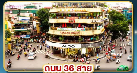
ถนน 36 สาย