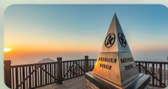
ฟานซีปัน