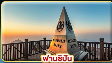
ฟานซีปัน