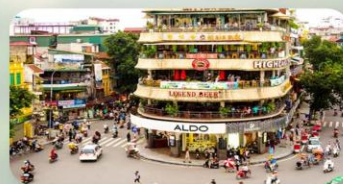
ถนน 36 สาย