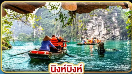
นิงห์บิงห์