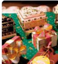
กล่องดนตรี MUSIC BOX