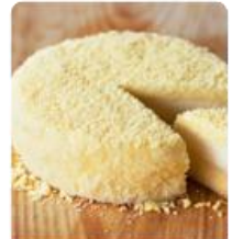
ร้าน LaTAO ร้านเบเกอรี่แบบอร่อย อีกรอบรสชาติใน ร้านรสอร่อยไม่แพ้ร้านอื่น ชิมแล้ว ต้องหลงใหลแน่นอน