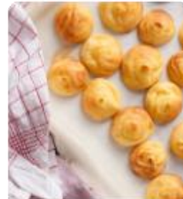
ร้าน KITAKARO ซึ่งมีขนมแบบจากตาลดๆ โดนๆ ให้ช้อปขนมอร่อยๆกับเค้กช็อกโกแลต และขนมเค้กช็อกโกแลตเป็นของขวัญ