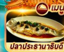
ปลาประธาราธิบดี