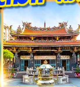
วัดหลงชาน