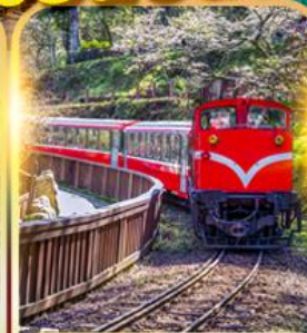
อุทยานอาหลี่ซาน