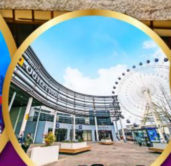
มิตซูเอะทาลีตพาร์ค เซนได