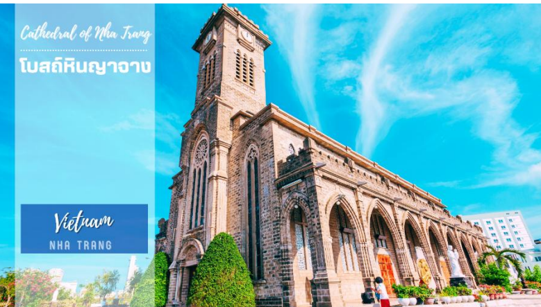
Cathedral of Nha Trang โบสถ์หินญาจาง Vietnam NHA TRANG

โบสถ์ถูกสร้างด้วยบล็อกซีเมนต์ และใช้หินในการปูพื้น