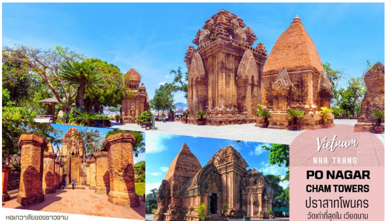
หอแก้วลายของชาวจาม

จากนั้นนำท่านชม โบสถ์หินนาตรัง เป็นโบสถ์ที่ใหญ่ที่สุดในเมืองญาจาง ตั้งโดดเด่นอยู่บนเนินสูง 10 เมตร ห่างจากทะเลเพียงแค่ 1กิโลเมตร โบสถ์หลังนี้ถูกสร้างขึ้นในสไตล์ฝรั่งเศสโกธิกโดยนักบุญหลุยส์วอลเล็ท ภายในโบสถ์ถูกตกแต่งด้วยกระจกสี มีสีอันสวยงาม ด้านในสามารถจุคนได้ถึง 600 คน ตัว