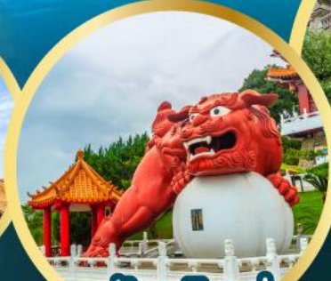
วัดเหวินหู่