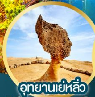
อุทยานเย่หลิว