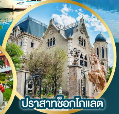
ปราสาทช็อกโกแลต

พิเศษ! บุฟเฟต์ซาบูทมาล่า สไตส์ไต้หวัน, เสี่ยวหลงเปา