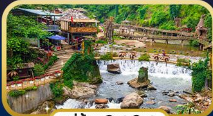
หมู่บ้าน Cat Cat