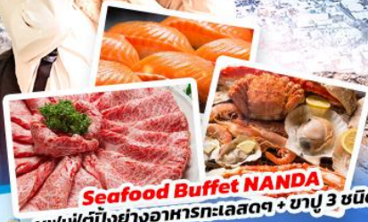
Seafood Buffet NANDA บุฟเฟต์บั้งย่างอาหารทะเลสดๆ + ซาปู 3 ชนิด

เส้นทาง ธันวาคม 66 - มกราคม 67 สายการบิน Thai AirAsia X (XJ) น้ำหนักกระเป๋า 20 KG