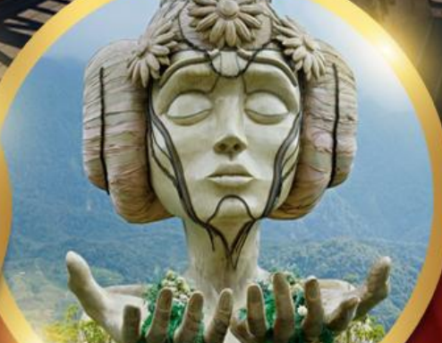
โมอานาคาเฟ่